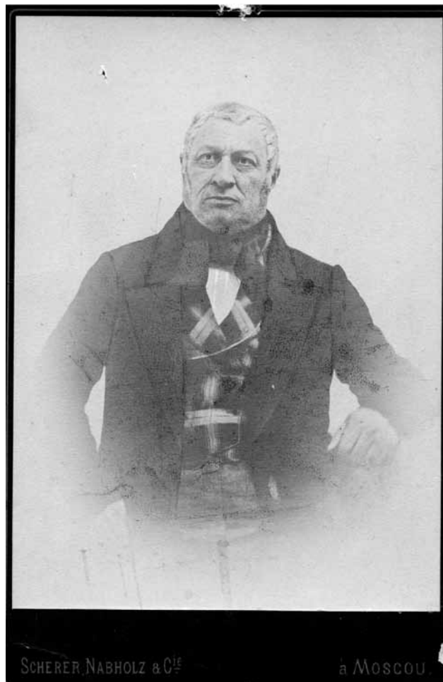
Ил. 5. Владимир Иванович Станкевич (1786–1851). Фотография. Москва. 40-е годы XIX в.

Из кружка Станкевича вышли Т. Н. Грановский, В. Г. Белинский, А. В. Кольцов, В. П. Боткин, Я. М. Неве-ров, поэты И. П. Ключников, В. И. Красов «и даже Гоголь обязан до некоторой степени нравственной поддержкой Н. Станкевичу... Для всех в кругу знакомых он был, казалось, путеводной звездой...» [1, 84]. И. С. Тургенев вспоминал, что, будучи в 1838 г. в Берлине, он познакомился с Н. Станкевичем и «очень скоро почувствовал к нему уважение и нечто вроде боязни, проистекавшей... от внутреннего сознания собственной недостойности и лживости... И в то же время невозможно передать словами, какое он внушал к себе уважение, почти благоговение... Станкевич оттого так действовал на других, что сам о себе не думал, истинно интересовался каждым человеком и, как бы сам того не замечая, увлекал его вслед за собою в область Идеала, — никто так гуманно, так прекрасно не спорил, как он» [5: 224, 227]. Ранняя смерть философа была для всех знавших его «великой утратой», а Т. Н. Грановский так скажет по поводу кончины друга: «... Он был человеком гениальным и святая душа. Все, кто к нему приближался, сознавали его превосходство, и никого это не унижало. Он мог бы покрыть славою десять имен и умер 27-ми лет, оставив по себе память лишь в сердце нескольких друзей. Его место останется среди нас незанятым» [6, 297]. В этих словах раскрывается всё обаяние личности Н. Станкевича, его роль и значение в истории русской культуры.