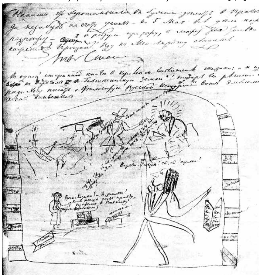
Ил. 4. Н. Станкевич. Эмблематическая виньетка. Берлин. 1838 г. Бум, карандаш, 16,3x18

Беккера (Becker) и Эйхлера (Eichler) опубликовано довольно много в разных изданиях. Если сравнить этот портрет с ними, то видно, с какой быстротою развивалась болезнь [чахотка — прим. Х. Л.] Николая Владимировича, так как исполнены они все в одном и том же, 1838-м, году, лишь в разные месяцы» [3, 5].