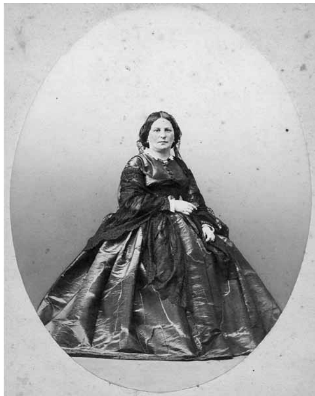
Ил. 11. Надежда Владимировна Станкевич, в замужестве Вульферт (1814–1898). Фотография. 1860-е годы (?). Публикуется впервые