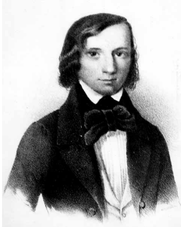
Ил. 1. Николай Владимирович Станкевич (1813–1840). Литография с акварели Л. Беккера (на обороте акварели надпись: «L. Becker. 1838»)