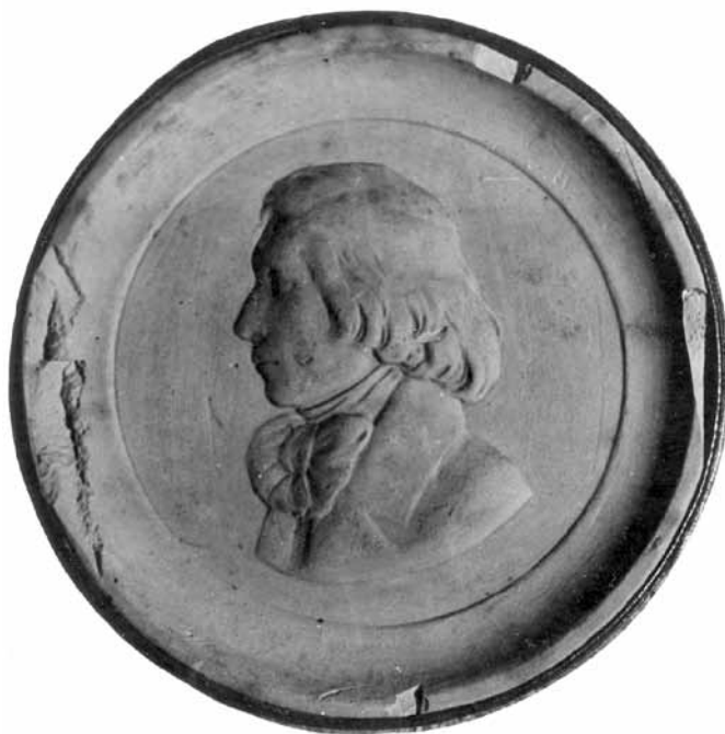
Ил. 2. К. Г. Эйхлер. Портрет Н. В. Станкевича. Берлин. 1838. Барельеф. Гипс. Диаметр 9,5 см.

Автор барельефа Карл Готфрид Эйхлер (1788–?) родился в Берне, гравёр, литограф. Можно предположить, что в 1838 году, в Берлине, состоялась встреча К. Г. Эйхлера