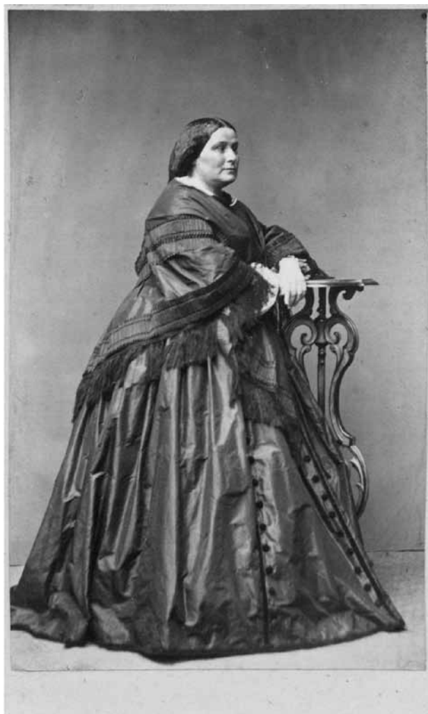
Ил. 12. Надежда Владимировна Станкевич. Фотография. Начало 1870-х гг. Публикуется впервые