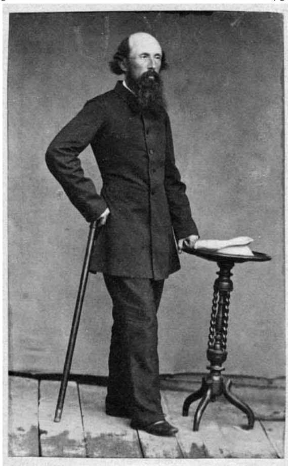
Ил. 6. Иван Владимирович Станкевич (1820–1907). Фотография. Москва (?). 90-е годы XIX в. Публикуется впервые

вещи, я имею с отцом много общего: в нем самом есть то же беспокойное начало, та же жажда деятельности и замыслов...» [3, 601]. А в одном из последних писем к родителям В.И. и Е.И. Станкевичам от 5 марта 1840 г. из Флоренции он с благодарностью и нежностью говорит о той силе родительской любви, которая окружала их, детей, привила в молодых сердцах доброту и стремление к истине. «Правда, — пишет Н. Станкевич, — мы все, может быть, немножко избалованы, но от избалованности скоро, слишком скоро, вылечивает жизнь; зато все мы, верно, единодушно скажем, что вашей любви обязаны мы всем, что только есть в самом деле хорошего в нас, что она сохранила сердца наши и открыла их для ощущений любви и дружбы, без которых жизнь не имеет смысла и без которых человек поневоле делается дурным...» [3, 147].