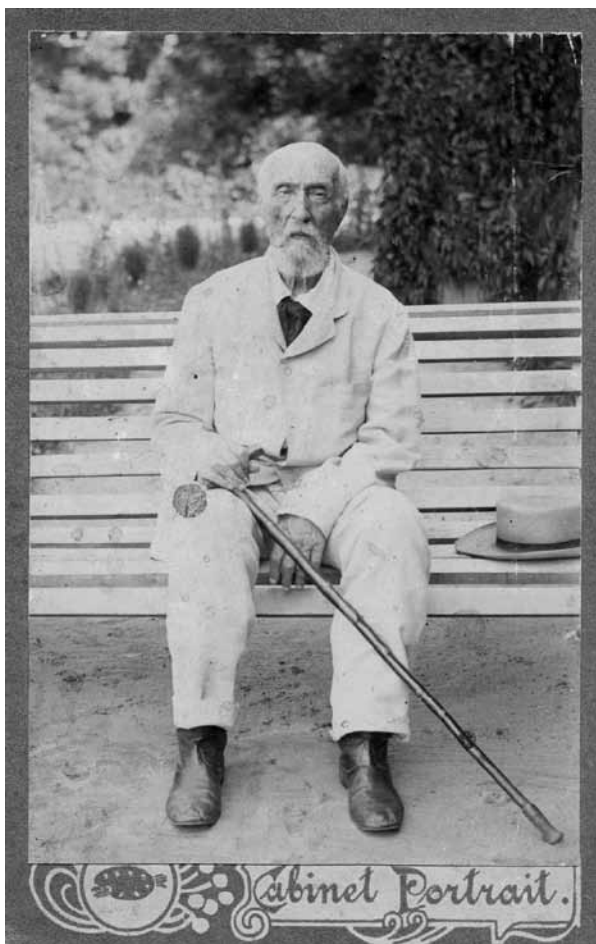
Ил. 8. Александр Владимирович Станкевич (1821–1912). Фотография. Москва. Нач. 1900-х гг. Публикуется впервые