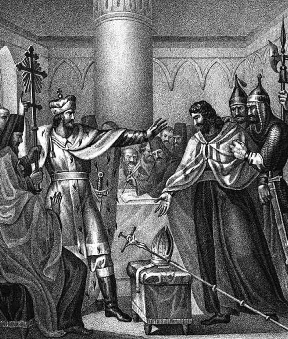
Великий князь Василий II отвергает Флорентийскую унию.