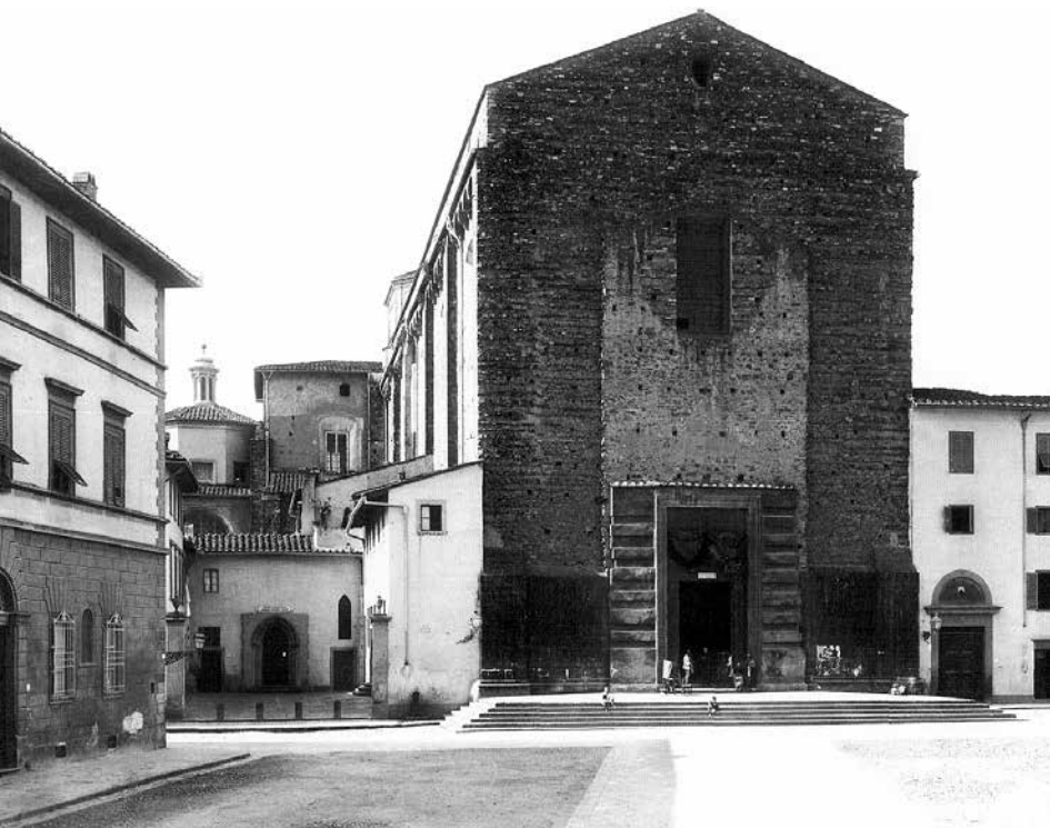
Церковь Санта-Мария дель Кармине.

“В этом же преименитом городе Флоренции в церкви Вознесения в четверг шестой недели после Пасхи, в самый этот праздник латиняне воспоминание творят в подобие древности, когда Иисус Христос в сороковой день вознесся со славой к отцу на небо. Посередине этой церкви есть помост, на левой стороне помоста устроен небольшой город каменный, чудный очень, с башнями и