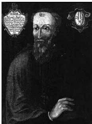
Исидор, Митрополит Киевский и Всея Руси.

1439 г. он отправился на Русь через Венецию; затем морем до хорватского берега; отсюда через Загреб, Будапешт и Краков в Литву. Из Вильны Исидор ездил в Киев, где Киевский князь Александр Владимирович дал “отцу своему Сидору” особую грамоту, которой подтверждались все права митрополита в “области киевской”.